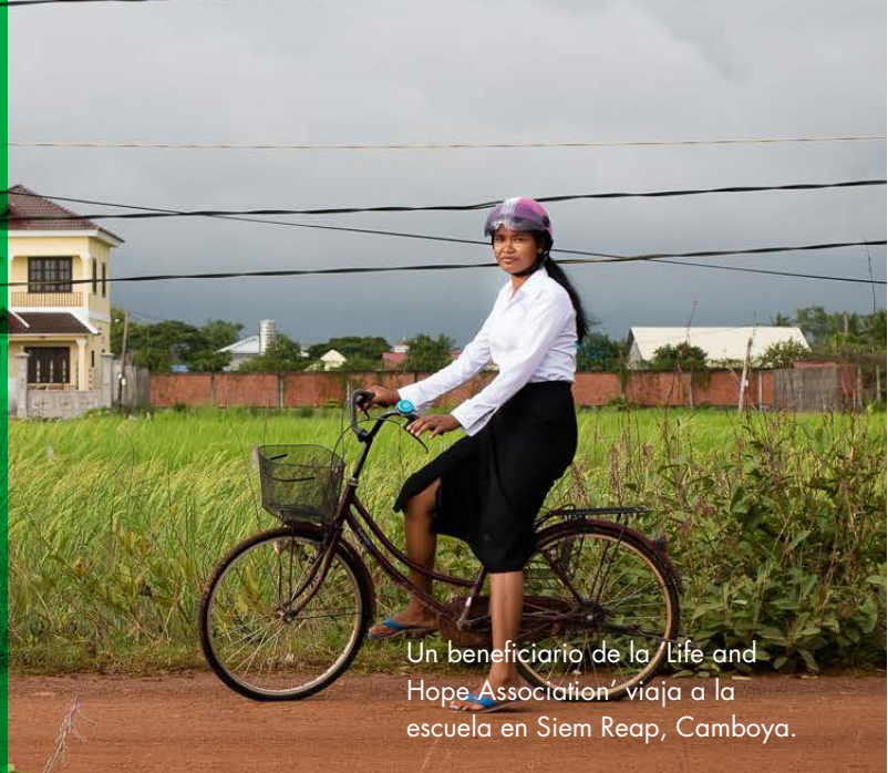
Un beneficiario de la 'Life and Hope Association' viaja a la escuela en Siem Reap, Camboya.